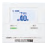
〈 台所リモコン※ 〉