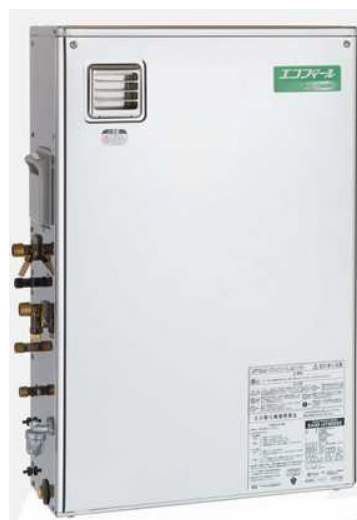
〈 給湯器本体 : EHKF-4751DSX 〉