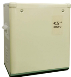
〈 電源ユニット本体 : BDU-300 〉